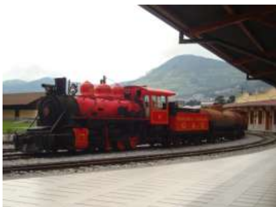
Estação Chimbacalle, Quito

No ano de 2007, sob a presidência do Economista Rafael Correa, começa a reabilitação do trem, não como um sistema de transporte coletivo, mas como uma herança cultural e histórica, como um grande produto turístico permitindo curtir e apreciar as belas paisagens, cenários e diferentes climas das regiões dos Andes e da Costa do Pacífico do Equador, bem como promover o desenvolvimento das economias locais das vilas e cidades, através do qual percorre o sistema ferroviário.