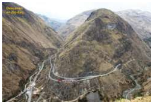
Nariz do Diabo