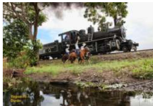
Trem a vapor