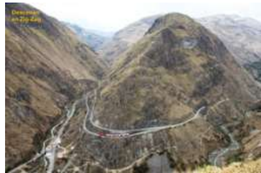
Nariz del Diablo