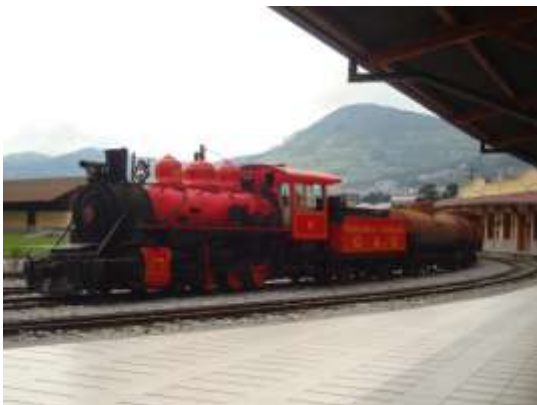
Chimbacalle Station, Quito

Im Jahre 2007, unter dem Vorsitz von Rafael Correa, begann die Altbaurenewerung vom Zugsystem, aber nicht als Massentransportsystem vorgesehen, sondern als kulturelle und historische Erbe und als ein großes touristisches Produkt. Mit dem Laufe des renovierten Schienensystem kann man die schönen Landschaften und die verschiedenen Klimazonen der Anden und Pazifik-Küste von Ecuador auf einer anderen Art und Weise schätzen und gleichzeitig wird auch die lokale Wirtschaft in den Städten und Gemeinden gefördert.