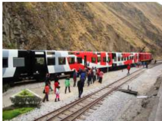
Sibambe Station, "Nariz del Diablo"