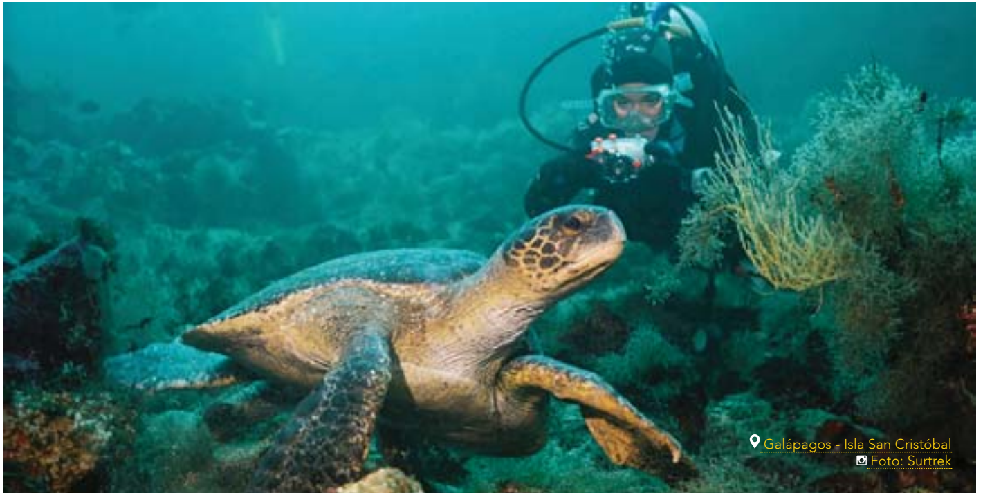
Galápagos - Isla San Cristóbal